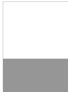
1/3 Seite B 210mm x H 99mm