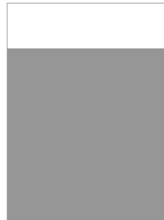
3/4 Seite quer B 210mm x H 223mm