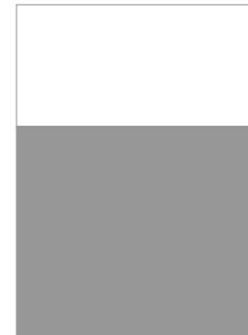
2/3 Seite quer B 210mm x H 198mm